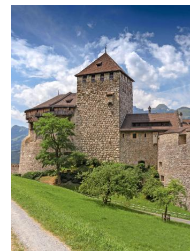
Ab 2022 sollen in Vaduz neue Busse fahren.

VADUZ. Der staatsnahe Betrieb Liemobil hat die Fahrleistungen für den öffentlichen Busverkehr ausgeschrieben. Die neuen Verträge sollen ab 2022 für zehn Jahre gelten. Die Rahmenbedingungen für den Betrieb, wie etwa Ausstattung und Höhe der Löhne, setzt Liemobil fest. Der Gesamtwert der Ausschreibung liegt bei rund 170 Millionen Franken. (sta)