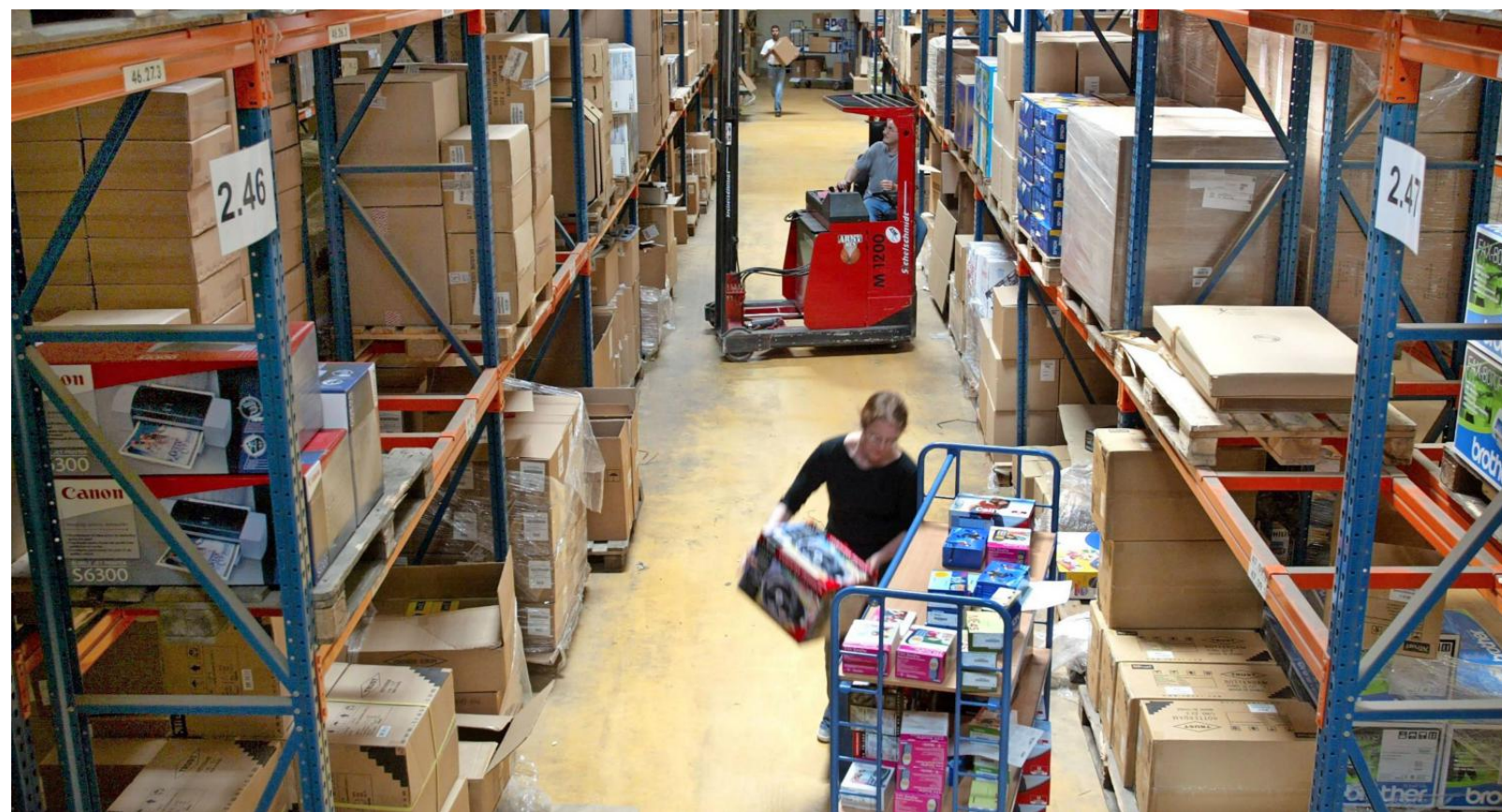
Die öffentliche Hand hat sich verpflichtet, beim IT-Einkauf die soziale Nachhaltigkeit zu beachten.

MEHR ZUM THEMA Weitere Informationen zum Thema Umgang mit unvorhergesehenen Ereignissen in Vergabeverfahren finden Sie unter: https://blog.staatsanzeiger.de